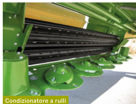
Condizionatore a rulli