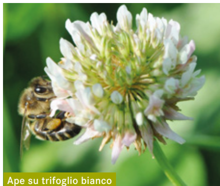
Ape su trifoglio bianco

Quando si utilizza la falciatrice con condizionatore, la perdita di api mellifere è compresa tra il 32% e il 62% .