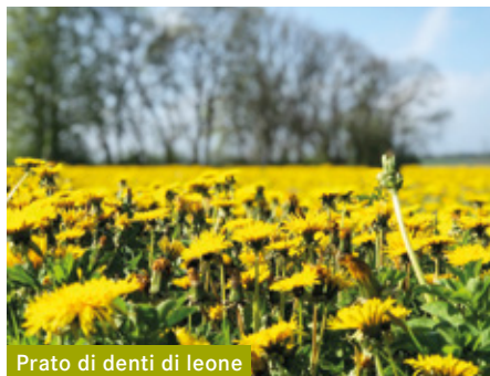
Prato di denti di leone

Con barre a lama è sempre possibile eseguire la falciatura – esistono anche macchine moderne per questo scopo.