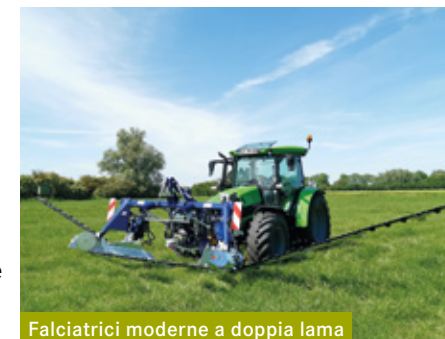
Falciatrici moderne a doppia lama

Le falciatrici moderne a doppia lama offrono diversi vantaggi e falciano anche in modo rispettoso degli insetti: