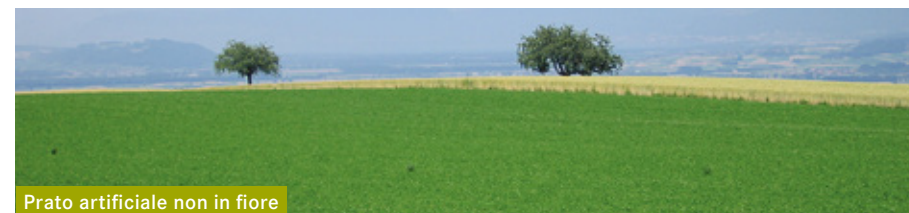
Prato artificiale non in fiore

Molte miscele a base di graminacee e trifoglio contengono trifoglio bianco. A causa delle dimensioni ridotte del trifoglio bianco, le api si trovano particolarmente in basso nel prato e vengono completamente colpite. Quindi: niente condizionatore nei prati in fiore. 4