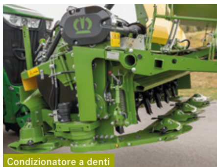
Condizionatore a denti